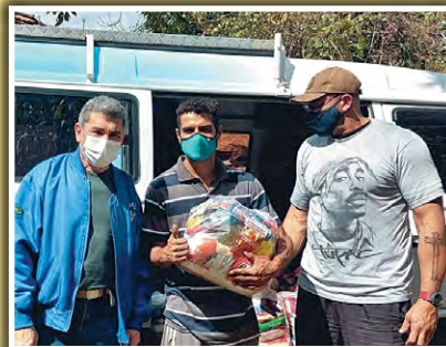
Doação de alimentos na Comunidade Sol-Nascente