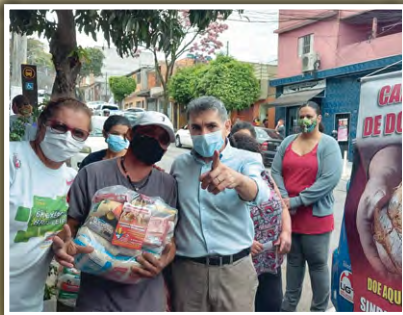
Doação de alimentos para a população no Jardim Eledy