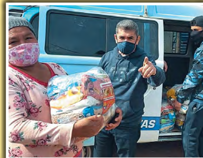
Doação de alimentos na Comunidade Sol-Nascente