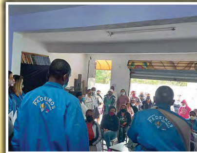
Doação de alimentos para moradores do Jardim Turquesa