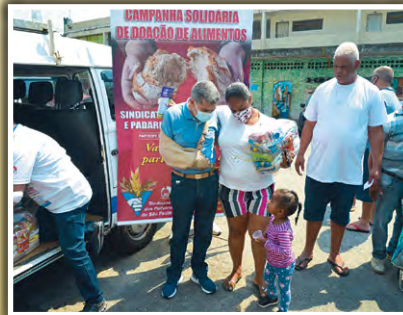
Doação de Alimentos na Associação Projeto Renascer Hadassah