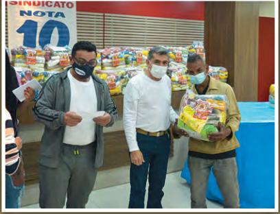
Doação de alimentos para moradores do Bixiga-Bela Vista