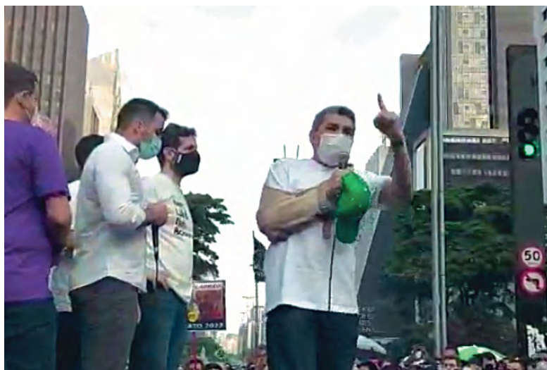
Manifestação na Av. Paulista reúne milhares de pessoas e exige o impeachment do presidente Bolsonaro já!

“É uma vergonha ser governado por uma quadrilha que saqueia o nosso povo. Precisamos passar a limpo o País, qualificando melhor o voto e não elegendo pessoas incapazes e grupos de arruaceiros para administrar o Brasil. Este protesto é também em respeito às famílias e às 600 mil vidas perdidas pela covid, por incapacidade e teimosia de um analfabeto que nunca respeitou nem incentivou as medidas de prevenção e vivia receiptando