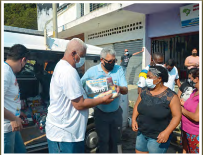
Doação de alimentos na Associação Projeto Renascer Hadassah