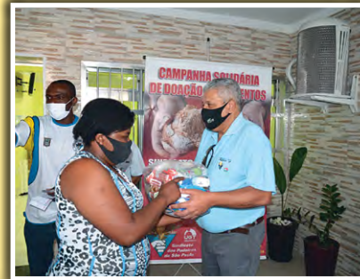
Doação de alimentos na subsele do Sindicato em São Miguel Paulista