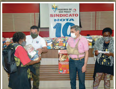
Doação de alimentos para a Associação Mulheres Unidas Venceremos