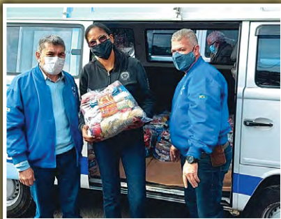
Doação de alimentos na Associação Projeto Renascer Hadassah