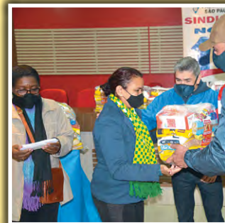
Doação de alimentos para moradores do Bixiga-Bela Vista