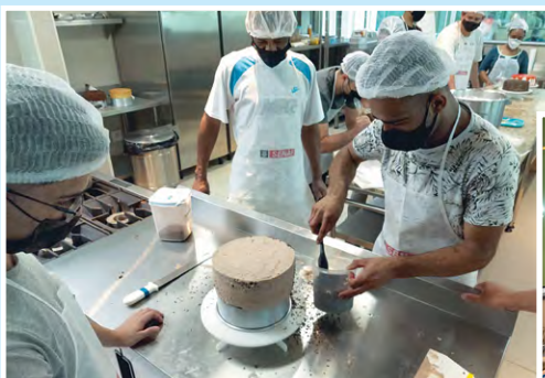
Alunos nas aulas práticas de panificação e confeitaria