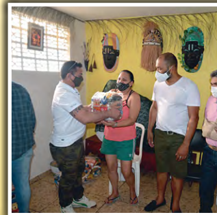
Doação de alimentos na Roça do Candomblé