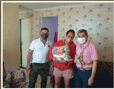
Doação de Alimentos em Guaianazes