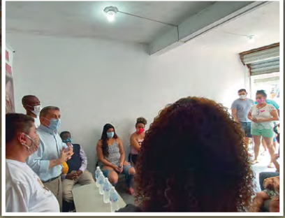
Doação de alimentos no Jardim Novo Horizonte, em Itapeverica da Serra