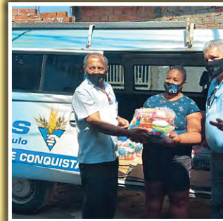
Doação de alimentos no Jardim Pantanal