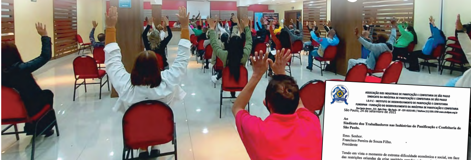
Assembleia virtual e presencial na sede do nosso Sindicato

C ompanheiros e companheiras. Conforme o ofício enviado para o nosso Sindicato, o setor patronal garante a data-base de 1º de novembro. Isto é uma boa notícia. O problema é que o patronal ainda não avaliou a nossa pauta de reivindicações nem formou sua comissão para dar início às negociações.