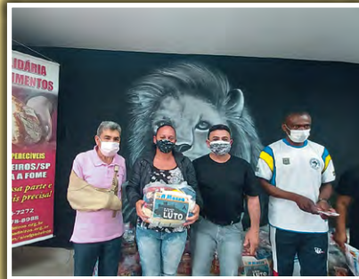
Doação de alimentos na Igreja Evangélica Rosa de Saron